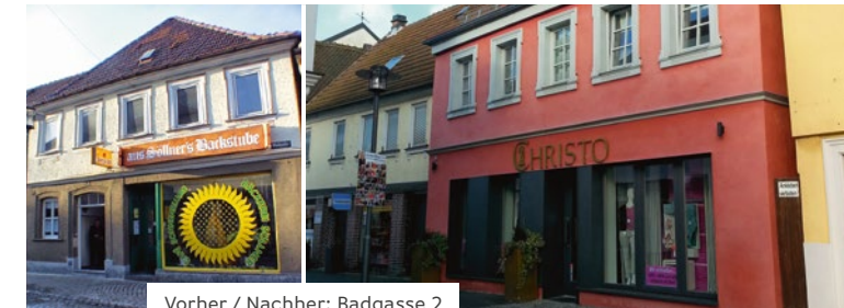
Vorher / Nachher: Badgasse 2